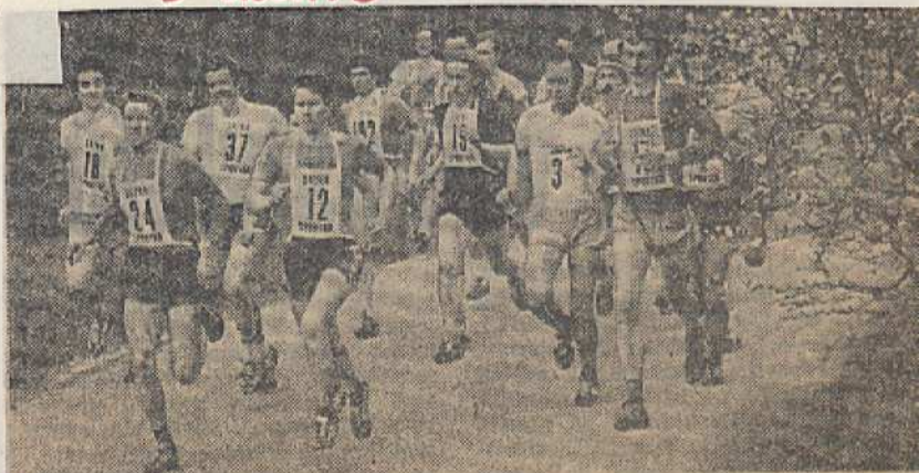
Objektiv našeho fotoreportéra zachytil účastníky hlavního závodu Memoriál Františka Chaloupeckého, který se uskutečnil v neděli v Praze-Počernicích.