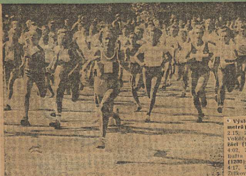
Ke svému závodu právě vyběhly na trať v konopištském amfiteátru starší zátkyně.

KONOPISTĚ (ula) — V zámeckém parku na Konopišti se večera již po čtvrté rozdávaly místenky na účast v celostátním finále Běhu Rudého práva mládeže.