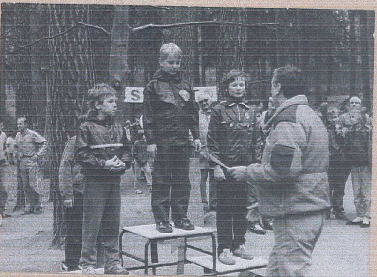
ML. ŽÁCI - VÍTEŽI OMDRA HAŠLAR