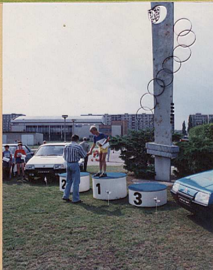
a takhle vypadal závod vloni 25.6.

Auto Škoda už obdržela nabídku od Českého olympijského výboru v Praze, zda je zájem pořádat ve čtvrtek 24. června 1993 Běh Olympijského dne i v Mladé Boleslavi. Odpověď, že ano, je už na ČOV. Teď se čeká na pozvání zástupce oddílu na schůzku pořadatelských měst v Praze.