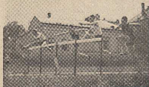
Překážky v lig. utkání s NSK Praha.