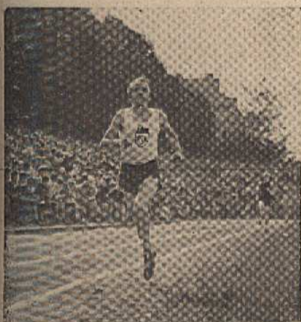
Dolenský v cílové rovině před Paulů NSK Praha.