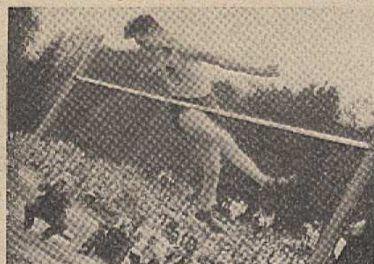
Také Zdeněk Sobotka zdolal výšku 180 cm.