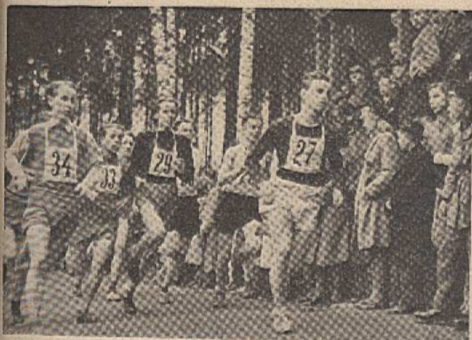
Běh Štěpánkou, dorost starší na trati.

usíme ve kte- lináhh míst. terých okem. radost-