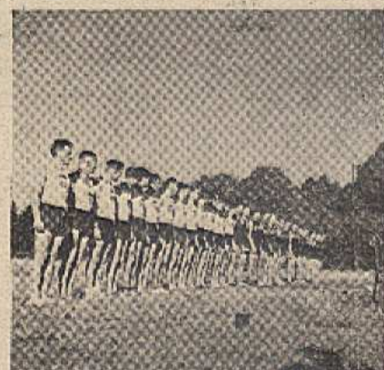
NSK Praha — Mi. Boleslav před bojem.