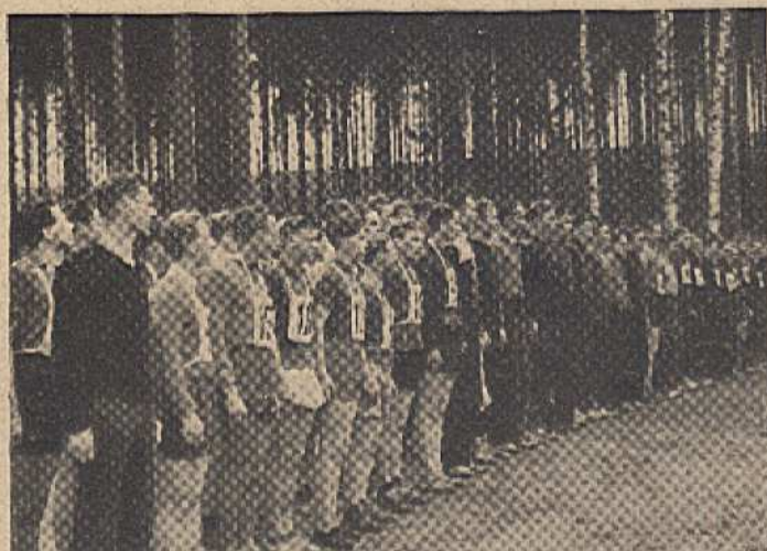
Nástup závodníků k populár. lesnímu běhu Štěpánkou.